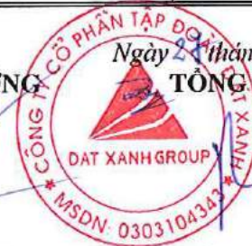
BUI NGOC ĐỨC